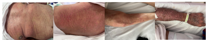
Figura 3. Se observa eritrodermia junto con lesiones en placa en diferentes regiones corporales a) tórax anterior, b) tórax posterior, c) extremidad inferior, d) extremidad superior. Estas lesiones se presentan posterior a inicio de quimioterapia.