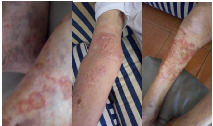
Figura 2. En la siguiente imagen se muestra las lesiones iniciales con las que debutó el paciente con su sintomatología el cual fueron progresando.